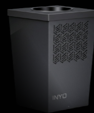
I-NEST PRO Trampa de ovoposición