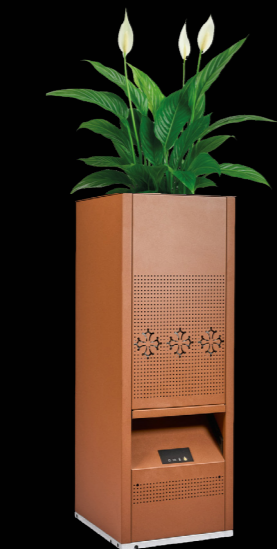
I-GARDEN PRO Diseño tipo jardinera