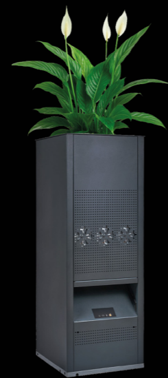
I-GARDEN Diseño tipo jardinera